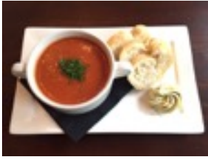
Tomatensoep* of Stokbrood kruidenboter € 4,50