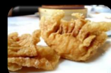
33.Pansit (Chicken) Gebakken pansit