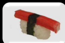
8. Kani (Crabstick) Krabstick