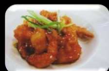
25 Chil Ha (schrimp) Grote chili garnalen