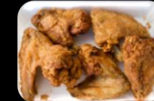
42.Kai Yi (chickenwings) Kipvleugels