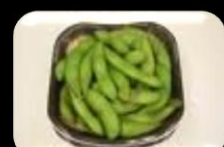
51. Edame (Beans) Gekookt bonen