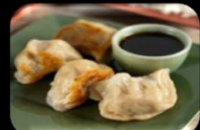
35. Gyoza (Dimpling) Gebakken kip in deegblad