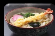
49. Ebi Udon Soup Bami soep garnalen