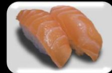
1.Sake (Salmon) Zalm