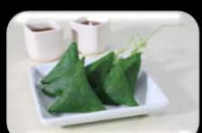
40. Vegetarisch Salmosa Vegetarisch pastei