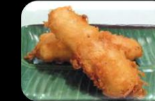
41. Pansit (Banana) Gebakken banaan