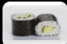
10.Kappa (Cucumber) Komkommer