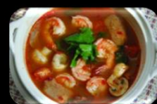
22. Yom yang kuung Thaise Tom Yom kung