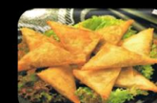
39. Salmosa (Red curry) Rode kerrie pastei