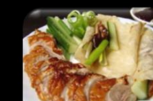
44. Duck in Pancake Eend in flensjes