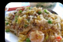
48. Fried Rice Yangzhou Nasi Yongzhou garnalen