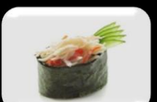
20.Kani Sarade(Crab) Krabsalade