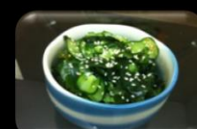
52.Cucumber Zuur komkommer