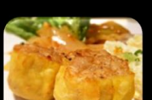
46. Siew Mai (meat) Vlees pastei