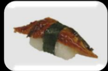
3.Unagi (Grilled eel) Paling