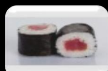
12.Tekkemaki (Tuna) Tonijn