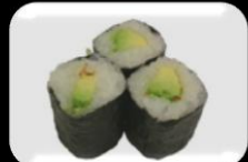
13.Osjinkomaki(pickels) Zoet-zuur rettich