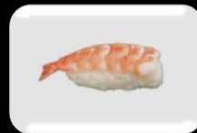
2.Ebi (Prawn) Garnalen