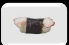
7.Tako (Octopus) Inktvis