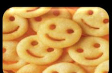
43. Fried Patatoes Smiles Gebakken aardappel schijf