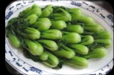
28. Mix vegetable Seizoen groenten