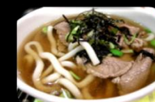
50. Gyu Udon Soup Bamo soep rundvlees