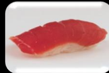
4.Maguro (Tuna) Tonijn