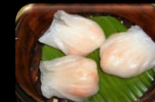
38. Ha Kau (Schrimps) Gestoomd garnalen