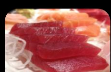
55. Sashimi Tuna Sashimi Tonijn