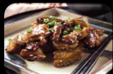
27. Tori (Chicken peper) Kippendijen peper