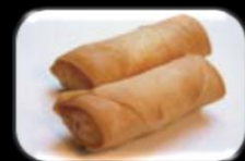
32. ChungKung (springroll) Mini loempia