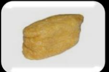
9. Inari (Tofu bag) Tofuzakje