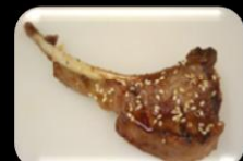
24. Ramu Yaki (Lamb) Lams