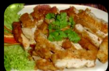
29. Tori tempura Gepaneerde kip