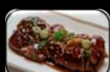
26. Gyu Yaki (Beef) Entrecote