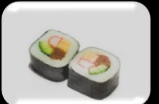
16.Futo Maki (Bigrol) Mix gevuld maki