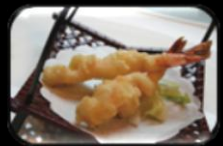
30.Yasai tempura Gepaneerde groenten