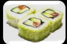
14.Spicy Tuna Maki Scherp tonijn maki