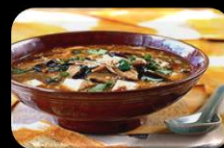
21. Hot and sour soup Zuur en pikant soep