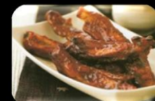
37. Bai Gu (Spareribs) Spareribs