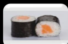
11.Sakemaki (Salmon) Zalm