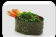
18.Wakame (Seaweed) Zeewier