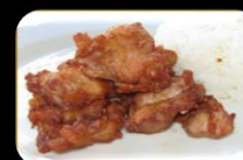
34. karaage (Chicken) Kip gember