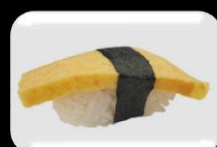
6.Tamago (Omelette) omelet