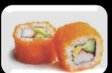
17.California Maki California maki