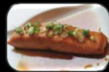
23.Sake (Gegrill zalm) Gegrilled zalm