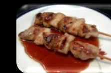
47. Yakitori (Satay) Sate yakitori