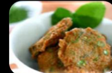
36.Tod Man Pla (fishcake) Thaise viskoek