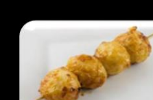
45. Chikuwa (Fish balls) Gebakken visballetjes