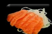
54. Sashimi Salmon Sashimi zalm