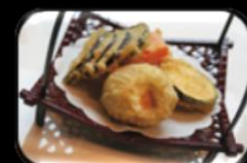
31. Ebi tempura Gepaneerde garnalen