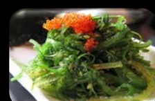
53. Wakame (Salad) Japanese zeewier salade