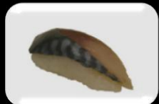
5.Saba (Mackerel) Makreel