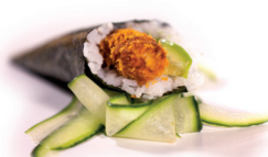
43 Crunchy Temaki 2,90 Gefrituurde garnaal, avocado