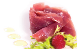
30 Sashimi Tonnish 7,25 Fijn gesneden tonijn