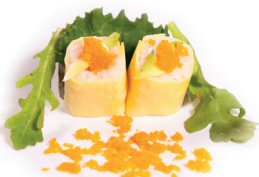
32 Cheese Sake Maki 1,50 Zalm, kaas