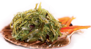
29 Chuka Wakame 2,60 Zeewiersalade