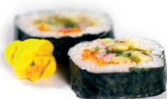
23 Futo Maki 2,30 Maki van krab, komkommer, zoete omelet, avocado