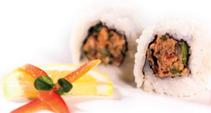
21 Spicy Tuna 2,95 Pittige tonijn