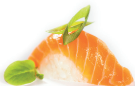
04 Sake O Nigiri 1,55 Nigiri van zalm met bosui