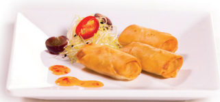
52 Loempia 3,80 Loempia's 3 st. (eend)