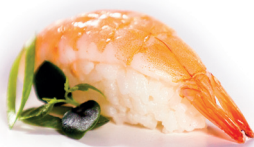
08 Ebi Nigiri 1,40 Nigiri van Steurgarnaal