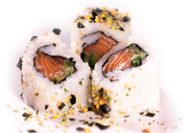
16 Salcum Maki 2,90 Zalm, komkommer