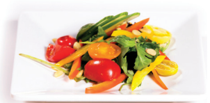
62 Frisse salade 3,50 Rucola, komkommer, cherrytomaten, paprika, pijnboompitten