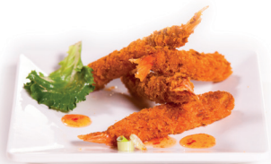
54 Kushi 5,75 Gefrituurde garnalen 4 st.