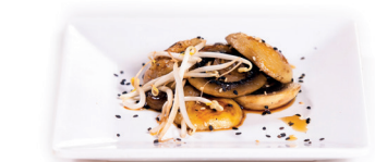
59 Yaki Mushroom 4,50 Gebakken champignons, teriyaki saus