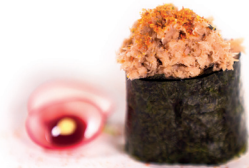
36 Ura Gunkan 1,90 Pittige tonijnslade