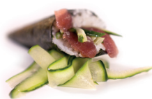
42 Maguro Temaki 2,90 Tonijn, komkommer