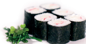
12 Kani Maki 2,50 Maki van krab