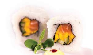
18 Sake Mango 1,75 Zalm, mango, komkommer