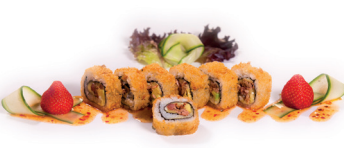
63 Fried Beef Roll 3,75 Krokante rol, vlees, avocado