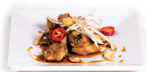
58 Kip Teriyaki 5,50 Gebakken kip, teriyaki saus