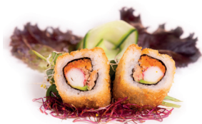
64 Fried Kani 3,50 Krokante rol, krab, tonijnslade, tobiko