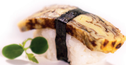
07 Tamago Nigiri 1,40 Nigiri van zoete omelet