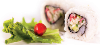
37 Fresh Crab 2,60 Verse krab rol