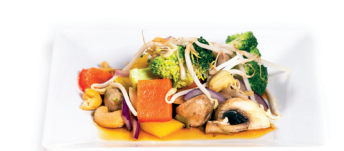
61 Tjap Tjoj 4,50 Gebakken groenten