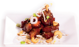
56 Tja Sieuw 4,60 Varkensvlees, zwarte bonensaus, cashewnoten