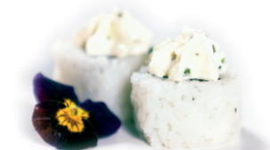
15 Philadelphia Maki 2,40 Zalm met Philadelphia kaas, komkommer