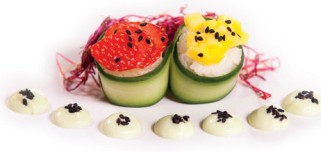
33 Changing Taste 1,80 Komkommer met fruit