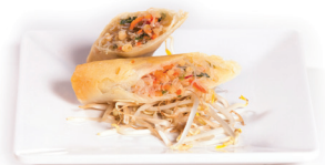
53 Vegetarische loempia 3,20 Vegetarische loempia's 2st.