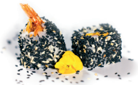
26 Kushi Maki 2,15 Gefrituurde garnaal