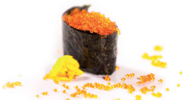
34 Tobiko Gunkan 1,90 Zalm met kaviaar