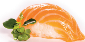
03 Sake Nigiri 1,50 Nigiri van zalm