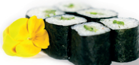
11 Kappa Maki 2,40 Maki van komkommer