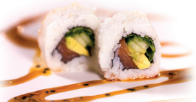
38 Green Sake 2,50 Zalm, avocado, komkommer, rucola