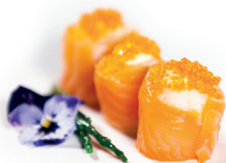
01 Sake Tobiko 3,10 Zalm met kaviaar