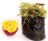
35 Wakame Gunkan 2,70 Zeewiersalade op een bedje van rijst