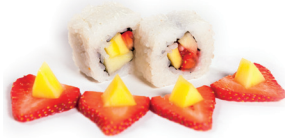
27 Fruity Maki 1,75 Mango, appel, aarbei