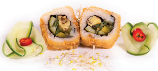
65 Veggie Fried 3,25 Krokante rol, zoete omelet, zeewier, komkommer, Japanse radijs