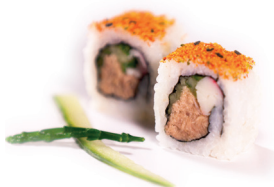
19 Ura Maki 2,10 Pittige tonijnsalade