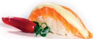
05 Smooth Salmon 1,60 Nigiri van zalm met wasabimayonaise