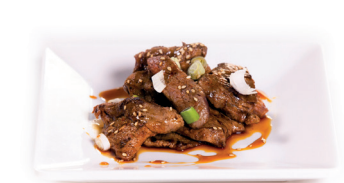
57 Beef Teriyaki 5,90 Gebakken runderreepjes, teriyaki saus