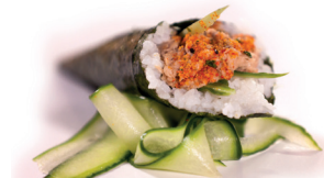
39 Kamikaze Temaki 3,10 Pittige tonijnslade, komkommer