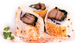
22 Lucky Tuna 2,90 Gegrilde pittige tonijn, komkommer