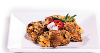
55 Tatsuka Kip 4,60 Krokante Kip