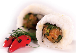
17 Spicy Salmon 1,95 Pittige zalm