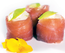
02 Lazy Tuna 3,25 Tonijn met avocado