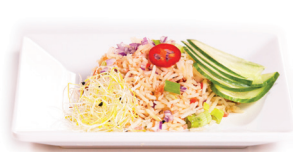
66 Japanse Rijst 4,75 Japanse rijst, bosui