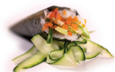
40 California Temaki 2,95 Krab, avocado, komkommer