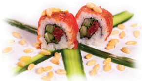
25 Carpaccio Maki 2,60 Carpaccio, komkommer, rucola