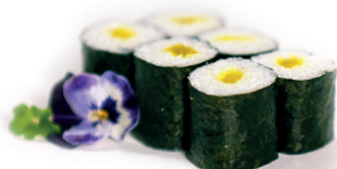
13 Oshinko Maki 2,40 Maki van Japanse radijs