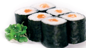
09 Sake Maki 2,95 Maki van zalm