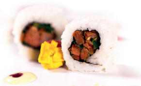
28 Tja sieuw rol 3,25 Tja sieuw, teriyaki