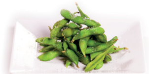
60 Edamame 3,75 Sojabonen