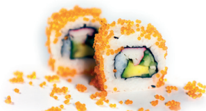
24 California Maki 1,60 Krab, avocado, komkommer