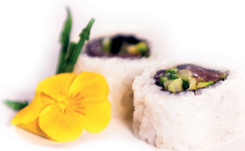
20 Ura Maki 2.0 2,50 Tonijn, avocado, komkommer