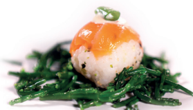
14 Sake Temari 1,10 Zalm met zeekraal