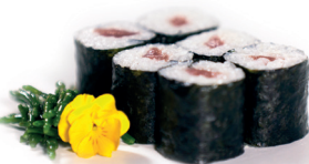
10 Tekka Maki 2,95 Maki van tonijn