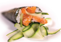
41 Sake Temaki 2,80 Zalm, komkommer