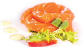
31 Sashimi Zalm 6,25 Fijn gesneden zalm