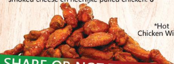
*Hot Chicken Wings

Platbrood uit de oven met een topping van smoked cheese en heerlijke pulled chicken. 6