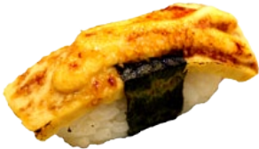
17. SWEET KEWPIE TAMAGO ZOETE OMELET