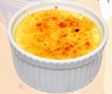
144. CRÈME BRÛLÉE