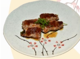
101. USU YAKI BEEFROL