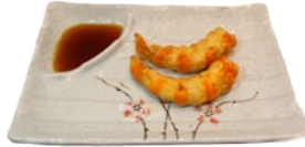
117. KANI NO EBI GARNAAL EN KRAB