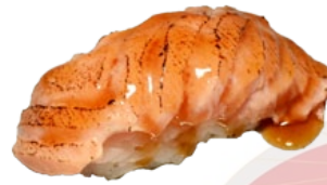
15. FLAMED SAKE GEFLAMBEERDE ZALM