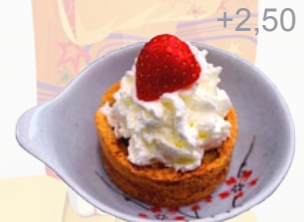
147. PINK BROWNIE KASTANJE & FRAMBOZEN