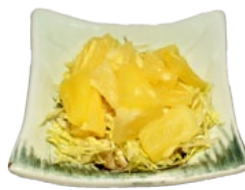
74. PAINAPPURU SARADE ANANASSALADE