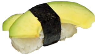
14. AVOCADO AVOCADO