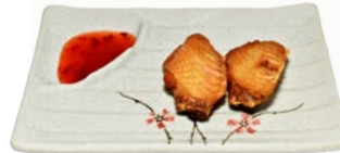
126. TEBA YAKI CHICKENWINGS