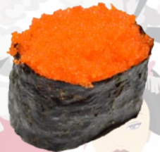
24. TOBIKO ORANGE VISEITJES