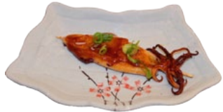
111. IKA KUSHI INKTVIS