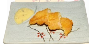
122. SUZUKI TEMPURA PANGAFILET EN TEMPURA FLAKES