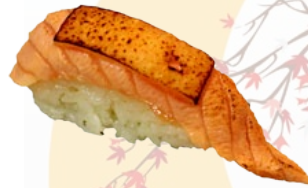
19. SAKE CHEESE GEFLAMBEERDE ZALM EN KAAS