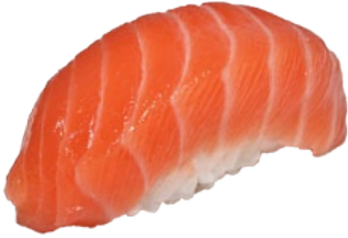
1. SAKE ZALM