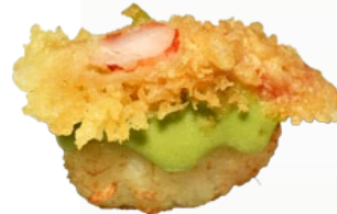
11. YUTAKANA GARNAAL EN AVOCADO