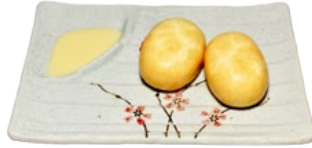
129. SWEET BUNS ZOETE BROODJES