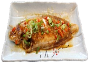
115. KENSAKU SHITA SLIBTONG