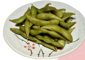
79. EDAMAME JAPANSE SOJABONEN