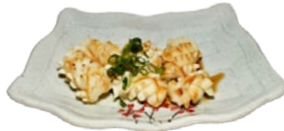
100. IKA YAKI INKTVIS