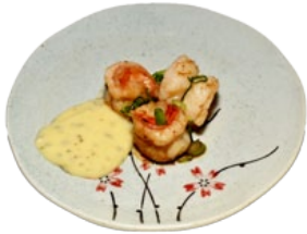
99. EBI YAKI GARNALEN