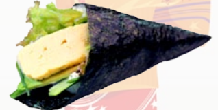
64. TAMAGO ZOETE OMELET