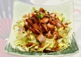
72. TORI SARADE GEFRITUURDE KIPSALADE