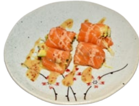
78. SAKE RAPPU GEWRAPTE ZALM