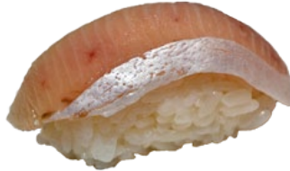
6. SABA MAKREEL