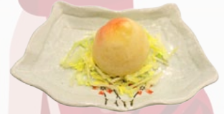
136. LOTUS BUN ZOET BROODJE