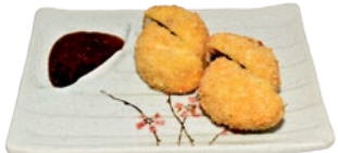
124. KINOKO TEMPURA CHAMPIGNONS EN TEMPURA FLAKES