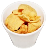
132. EBI KURAKKA KROEPOEK