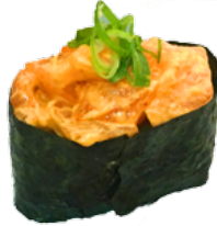
22. HOT SALMON ZALM EN AVOCADO