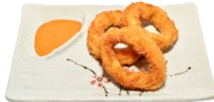
121. IKA TEMPURA INKTVIS EN TEMPURA FLAKES