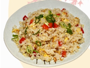
82. YAKI MESHI GEBAKKEN RIJST