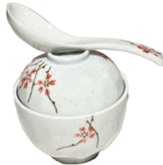
66. OSUIMONO VISSOEP