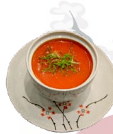
67. TOMATEN TOMATENSOEP