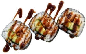
54. SUTEKI GEFRITUURDE KIP EN KOMKOMMER