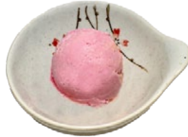
138. AARBEI IJS