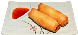
125. HARUMAKI LOEMPIA