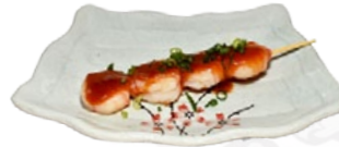
109. EBI KUSHI GARNALENSPIES