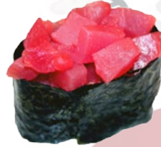
23. MAGURO TONIJN