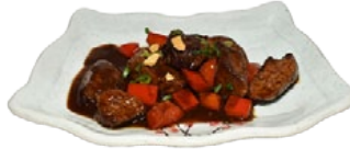
89. PEPPER BEEF GEPEPERDE BEEF