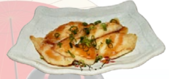
98. SUZUKI TERIYAKI PANGAFILET