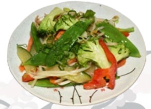
91. YAKI YASAI GEBAKKEN GROENTEN