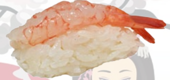
4. AMA EBI ZOETE GARNAAL