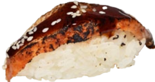
9. UNAGI PALING