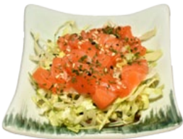
69. SASHIMI SARADE ZALMSALADE