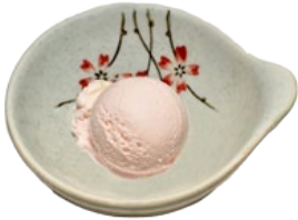
141. LYCHEE IJS