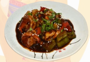
83. EBI TONKATSU GONBAO GARNALEN