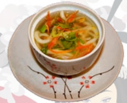
68. JAPANESE BAMI JAPANESE BAMISOEP