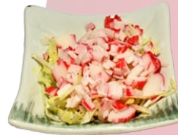
71. KANI SARADE KRABSALADE