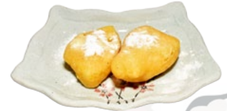
131. PAINAPPURU YAKI ANANAS