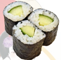
33. KAPPA KOMKOMMER