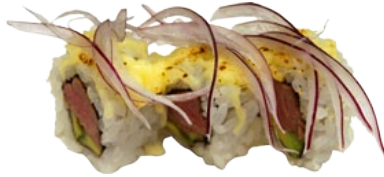
55. YOKUBO BEEF