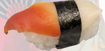
8. HOKKIGAI SURFMOSSEL