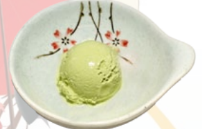
140. GROENE THEE IJS