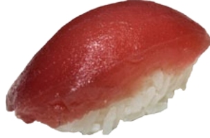
2. MAGURO TONIJN