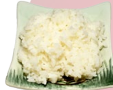
94. MESHI WITTE RIJST