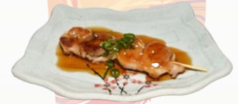
106. YAKITORI KIPSPIES