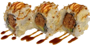
42. CRISPY TUNA TEMPURA FLAKES EN TONIJNTARTAAR