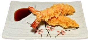
120. EBI TEMPURA GARNALEN EN TEMPURA FLAKES