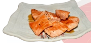
97. SAKE TERIYAKI ZALM