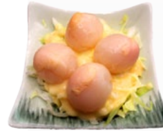
75. LYCHEE SARADE LYCHEESALADE