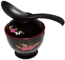
65. MISO SHIRU MISOSOEP