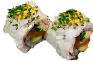
47. KURIMU SAKE GEROOKTE ZALM EN ROOMKAAS