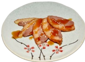
103. KAMO YAKI EENDENBORSTFILET