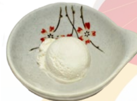
139. VANILLE IJS