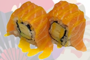
49. MANGO SAKE MANGO EN ZALM