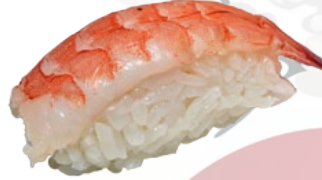
3. EBI RAUWE GARNAAL