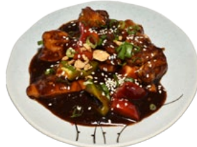
85. GONBAO CHICKEN KIP EN GROENTEN