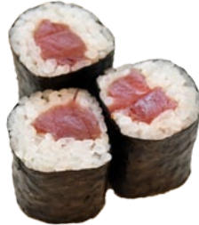
31. TEKKA TONIJN