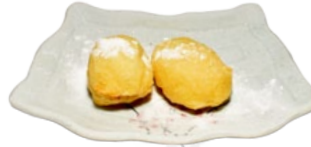
130. PISANG KATSU BANAAN