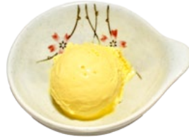
142. MANGO IJS