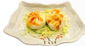
135. XIAO LONG BAO GROENTE PASTEI