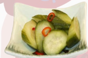
76. SUNOMONO ZOETZURE KOMKOMMER