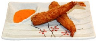
116. EBI FRY GARNALEN