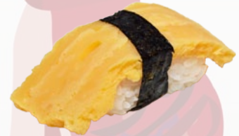
12. TAMAGO ZOETE OMELET