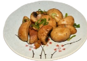
93. KINOKO CHAMPIGNONS