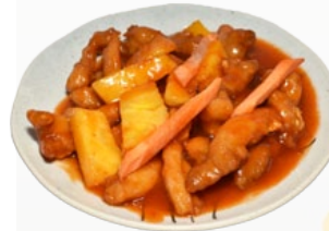
86. AMAZUPPAI CHIKIN ZOETZURE KIP