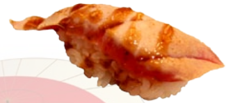
16. FLAMED MAGURO GEFLAMBEERDE TONIJN