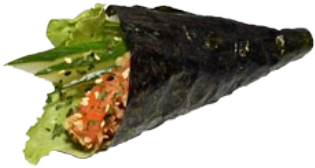
57. SAKE ZALM HANDROLL