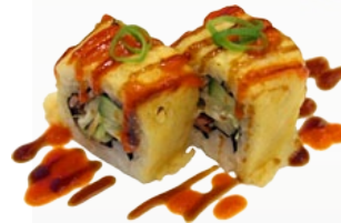
40. BACON CHEESE SPEK EN KAAS