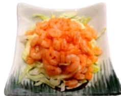
70. EBI SARADE GARNALENSALADE