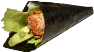
61. HOT TUNA TONIJNTARTAAR HANDROL