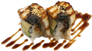
50. UNAGI PALING