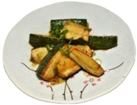
92. ZUKINNI COURGETTE