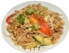
80. NIPPON MENRUI GEBAKKEN VERMICELLI MET GROENTEN