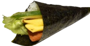
62. VEGGI VEGETARISCHE HANDROLL