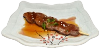
107. GYU KUSHI BEEFSPIES