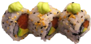
38. WASABI SALMON ZALM EN WASABI