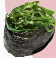
27. CHUKA WAKAME ZEEWIER