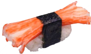
10. KANI KRAB