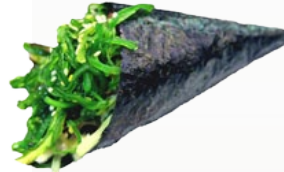
63. WAKAME ZEEWIER