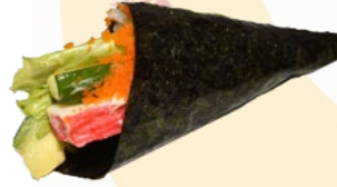
59. CALIFORNIA KRAB HANDROLL