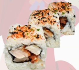
53. SPICY TORI GEFRITUURDE KIP