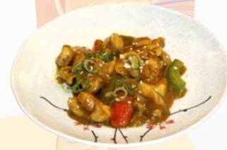
87. CHIKINKARE KIP KERRIE