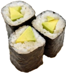
34. AVOCADO AVOCADO