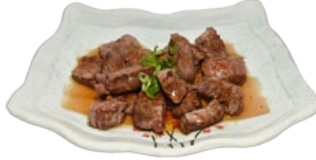
96. BEEF TERIYAKI BEEF BLOKJES