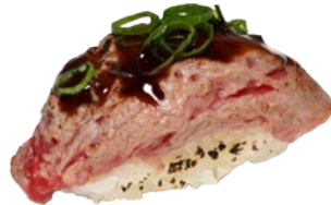
18. FLAMED BEEF GEFLAMBEERDE BEEF