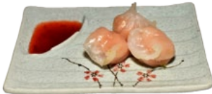
133. HAKAUW GARNALENPASTEI