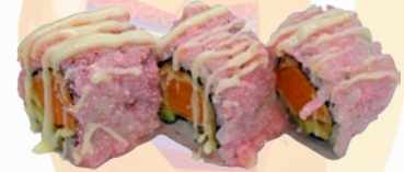
37. SWEET POTATO ZOETE AARDAPPEL