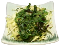
73. CHUKA WAKAME SARADE ZEEWIERSALADE