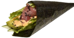
58. MAGURO TONIJN HANDROLL