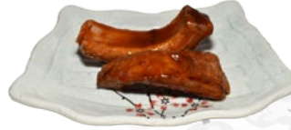
90. SUPEARIBU SPARERIBS