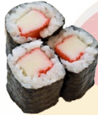
32. KANI KRABSTICK