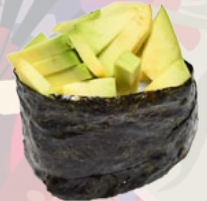
28. AVOCADO AVOCADO