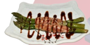
113. BACON ROLL ASPERGES EN SPEK