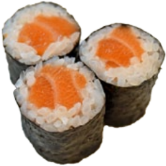
30. SAKE ZALM