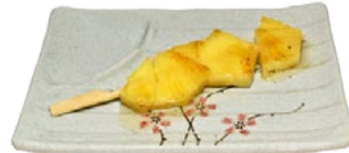
112. PAINAPPURU KUSHI ANANASSPIES