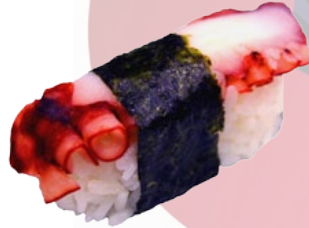
7. TAKO OCTOPUS