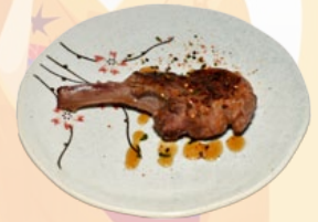
102. RAMU YAKI LAMSKOTELET