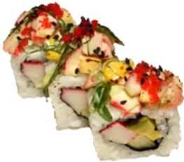
46. MERMAID KRAB, KOMKOMMER, MAIS, AVOCADO EN VISEITJES