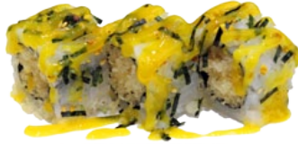
43. FRUITY CRISPY TEMPURA FLAKES EN MANGO