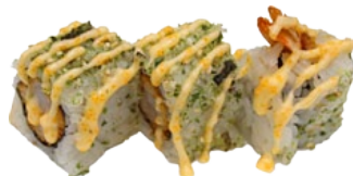
39. EBI TEMPURA GEFRITUURDE GARNAAL