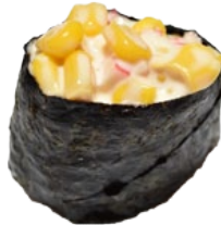
26. KANI CORN KRAB EN MAIS