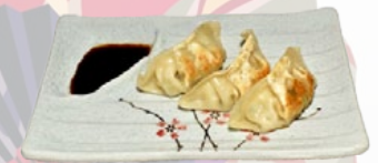
114. GYOZA VLEESPASTEI