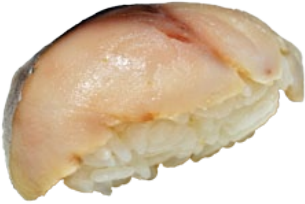
5. SUZUKI ZEEBAARS