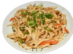
81. YAKI UDON UDON NOEDELN