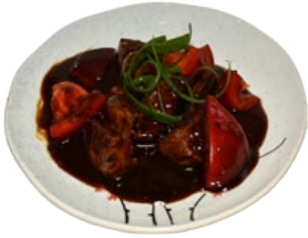
88. GYU TOGARASHI GONBAO BEEF