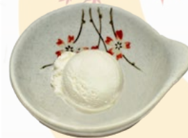
143. WITTE SESAM IJS