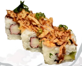
45. ONION GEBAKKEN UITJES, KRAB EN KOMKOMMER