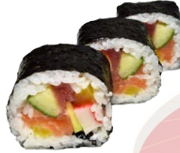
56. FUTO BIG ROLL