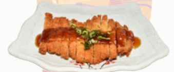
127. TORI NO KANAGE KIP