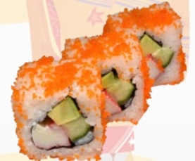
41. CALIFORNIA KOMKOMMER, AVOCADO EN KRAB