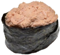
25. SPICY TUNA TONIJNTARTAAR