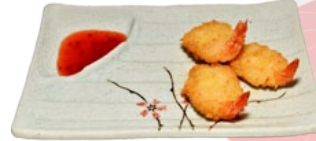
118. EBI FRY SUKOSHI MINI GARNALEN