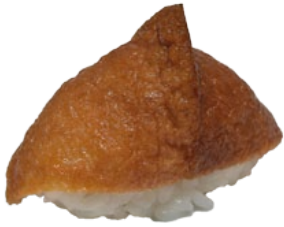
13. INARI TOFU