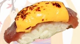
20. MAGURO CHEESE GEFLAMBEERDE TONIJN EN KAAS