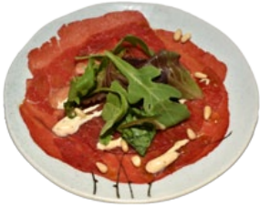
77. KANIPATCHA CARPACCIO