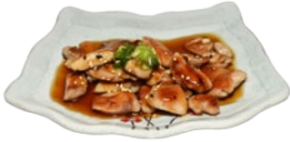
95. CHICKEN TERIYAKI KIPSTUKJES