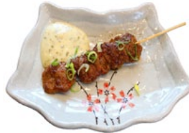
108. KOHITSUJI KUSHI LAMSSPIES