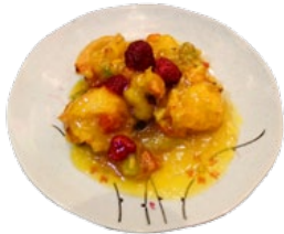
84. FURUTSU EBI GARNALEN MET FRUIT