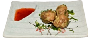
134. SIEUWMEI VLEESPASTEI (KIP)