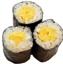
35. TAMAGO ZOETE OMELET