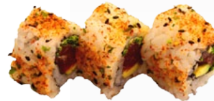
52. SPICY TUNA TONIJN EN AVOCADO