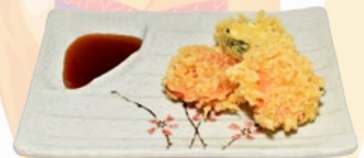
123. YASAI TEMPURA GROENTEN EN TEMPURA FLAKES