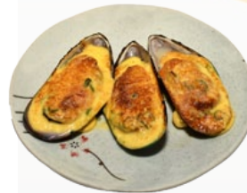
105. IGA I YAKI KEWPIE MOSSELEN MET JAPANSE MAYONAISE