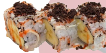
48. BANANA OREO BANAAN EN OREO