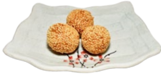
128. GOMABORU SESAMBALLEN