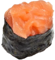
21. SAKE ZALM