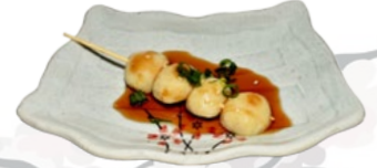
110. TSUMIRE KUSHI VISSPIES