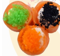
36. SALMON ROLL ZALM EN VISEITJES