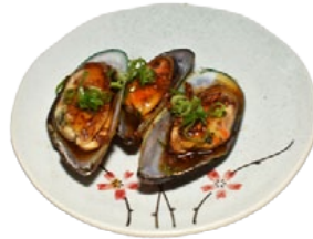
104. IGA I YAKI MOSSEL