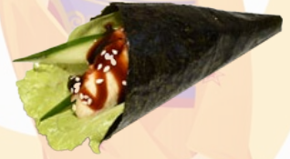
60. UNAGI PALING HANDROLL