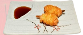
119. EBI KOROKKE AARDAPPELGARNAAL