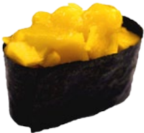
29. MANGO MANGO