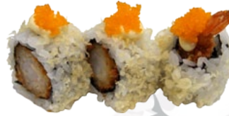
44. EBI CRISP GARNAAL EN TEMPURA FLAKES