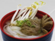
65. Phở Bò Noedelsoep rund