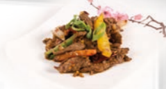
71. Bò Xào Sả Ót Pikante bief