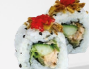
46. Sapporo Tonijn & zalm