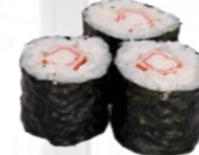
30. Kani Maki Krabstick