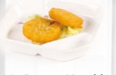
94. Potato Korokke Aardappelkoekjes