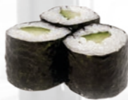
32. Kappa Maki Komkommer