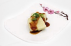
88. Tofu Furai Tofu