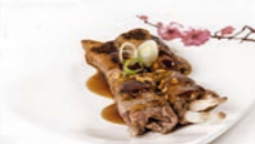
75. Usuyaki Ribeye biefrolletjes