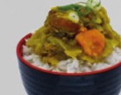
61. Cà Ri Gà Rijst met kip kerrie