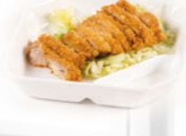
92. Tori Katsu Gepaneerde kip