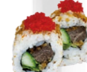
48. Marinated beef Gemarineerde bief