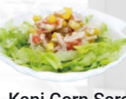
55. Kani Corn Sarada Krab mais salade