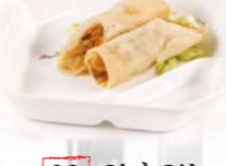
98. Chả Giò Vietnamese loempia's