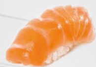
01. SAKE Zalm