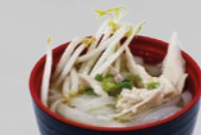
64. Phở Gà Noedelsoep kip