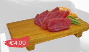
104. Maguro Sashimi Tonijn - 5 st.