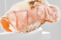
15. Flamed Sake Cheese Geflam. zalm met roomkaas