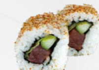
45. Spicy Tuna Pittige tonijn