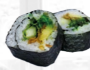
34. Futo Maki Vegetarisch