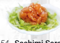
54. Sashimi Sarada Sashimi salade