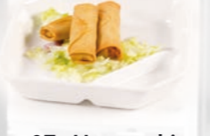
97. Harumaki Mini loempia's