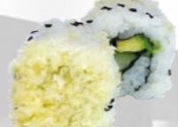
39. Crispy Krokant