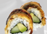
44. Unagi Paling