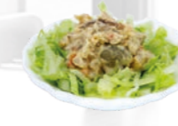
57. Sapporo Sarada Tonijn & zalm