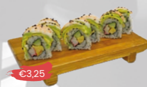
106. Ebi Avocado Roll Garnaal & avocado