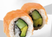
40. Smoked Sake Gerookte zalm