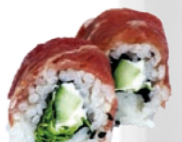
49. Karupatcho Carpaccio