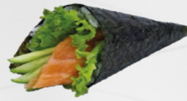
22. Sake Temaki Zalm handrol