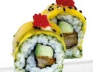
50. Mango Tori Mango kip