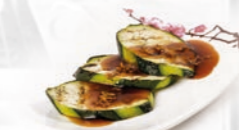
74. Yasai Mori Courgettes