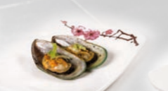
85. Green Shell Mussels