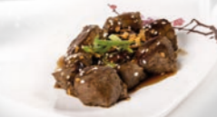
77. Bò Lúc Lắc Biefstukjes