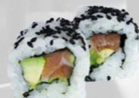
36. Sake Avocado Zalm avocado