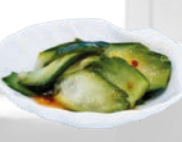
58. Kyuri Tsukemono Zoetzure komkommers