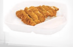
91. Sakana Katsu Gepaneerde witvis