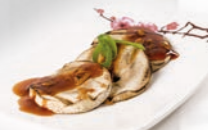
73. Yaki Kinoko Champignons