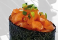
19. Sake Gunkan Zalm