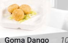
99. Goma Dango Sesamballen