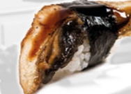
14. Flamed Unagi Geflambeerde paling