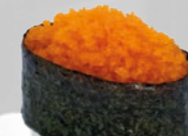
17. Tobiko Gunkan Vliegende vis eitjes