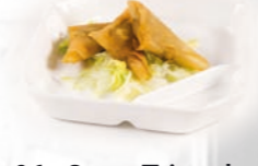
96. Curry Triangles Kerrie driehoekjes