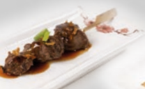
79. Gyu Kushi Biefspies