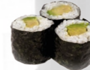
31. Avocado Maki Avocado