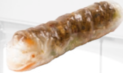
69. Gỏi Cuốn Bò Bief lenterol