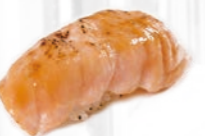
12. Flamed Sake Geflambeerde zalm