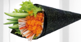
26. California Temaki California handrol