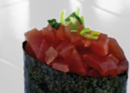
20. Maguro Gunkan Tonijn