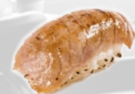
13. Flamed Maguro Geflambeerde tonijn