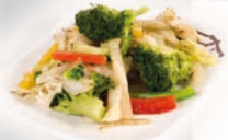
70. Yasai Itame Seizoensgroenten