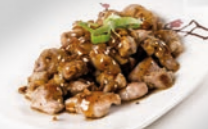
76. Tori Teriyaki Kipstukjes