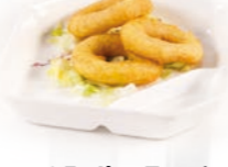
95. Ika Furai Inktvisringen