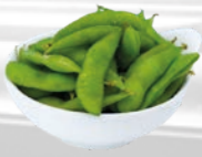
59. Edamame Sojabonen