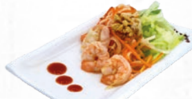
53. Gỏi Tôm Garnaal salade