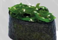
16. Wakame Gunkan Zeewier