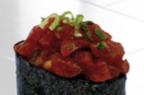
21. Spicy Sashimi Gunkan Pittige tonijn & zalm