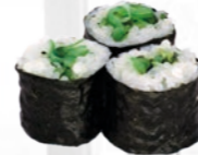
33. Wakame Maki Zeewier