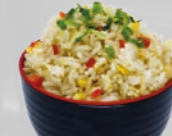
62. Yaki Meshi Gebakken rijst