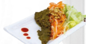
52. Gỏi Bò Bief salade