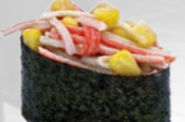
18. Kani Corn Gunkan Krabstick & mais