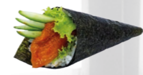
27. Spicy Sashimi Temaki Pittige tonijn & zalm