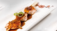
81. Sake Kushi Zalmspies