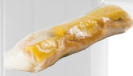
67. Gỏi Cuốn Chay Vegetarische lenterol