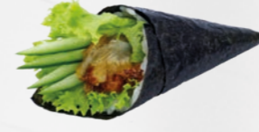
24. Unagi Temaki Paling handrol