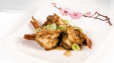
72. Tôm Xào Garnalen