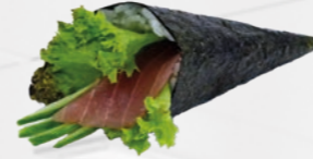
23. Maguro Temaki Tonijn handrol