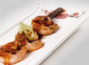
82. Ebi Kushi Garnalenspies