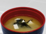
66. Miso Shiru Miso soep