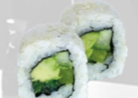
38. Yasai Vegetarisch