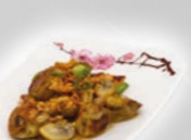
86. Ebi To Kinoko Garnalen & champignons