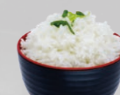
60. Gohan Gestoomde rijst