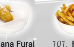
100. Banana Furai Gefrituurde banaan