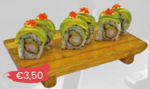
105. Dragon Roll Krokante garnaal & avocado