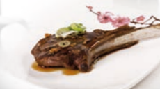
78. Kohitsuji Lamskotelet