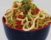
63. Yaki Soba Gebakken noedels