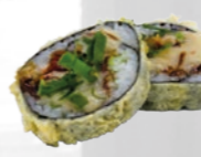
35. Furai Maki Gefrituurd