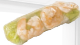
68. Gỏi Cuốn Tôm Garnalen lenterol