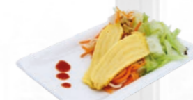
51. Gỏi Chay Vegetarische salade