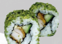
42. Tori Kip