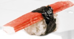
05. Kani Krabstick