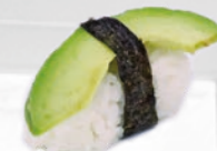
07. Avocado Avocado