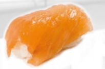
09. Smoked Sake Gerookte zalm