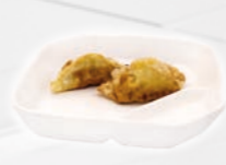
89. Gyoza Kippasteitjes