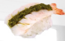
04. Ebi Pesto Garnaal met pesto