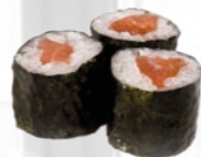
28. Sake Maki Zalm