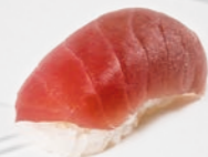
02. Maguro Tonijn