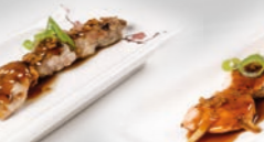
80. Yakitori Kipspies