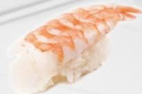
03. Ebi Garnaal