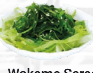
56. Wakame Sarada Zeewier salade