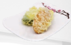
87. Tempura yasai Wortel & courgette