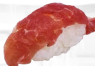
10. Karupatcho Carpaccio