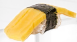
06. Tamago Zoete omelet