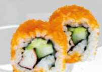
37. California California