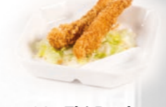
93. Ebi Panko Krokante garnaal