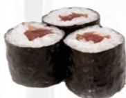
29. Tekka Maki Tonijn