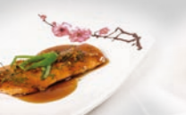
83. Sake Zalm