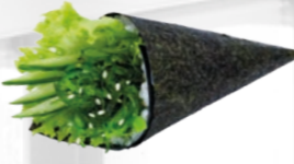
25. Wakame Temaki Zeewier handrol