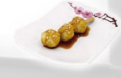
90. Sakana Kushi Visspies