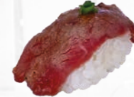
11. Flamed Beef Geflambeerde bief