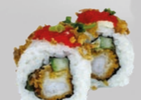
43. Fried Ebi gefrituurde garnaal