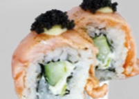
41. Sake Cream Cheese Zalm met roomkaas