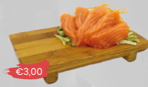
103. Sake Sashimi Zalm - 5 st.