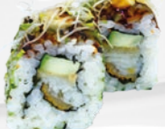
47. Soru Tongfilet