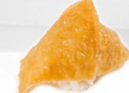
08. Inari Zoete tofu