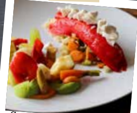
Gevulde puntpaprika met gegrilde groenten, couscous