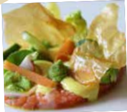
Zalm tartaar met filodeeg, avocado en kerriemayonaise