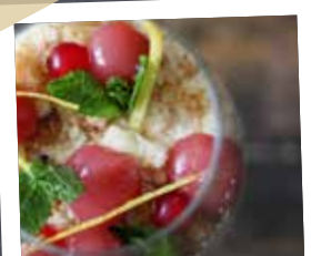
Perzik parfait met een sinaasappelmousse