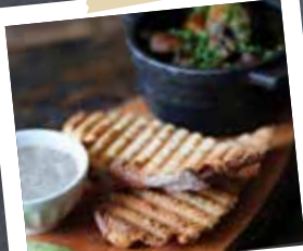
Gebakken champignons, Duxelles dip, kruidenboter