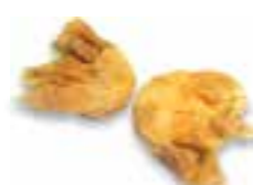
87. CHA SOI KAU Geb. garnalenpastei