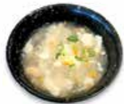
78. GEBONDEN SOEP MET ZEEVRUCHTEN