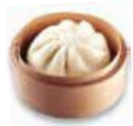
84. TJA SIEU BAO Broodje met ger. vlees