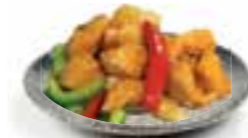
102. KOE LO KAI Geb. kip in zoetzure saus