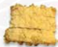
94. FOE PHEE PEN Krokante garnalenkoek