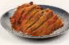
53. TORI TANKATSU Gefrituurde kip