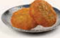
54. POTATO SLICES Aardappelkoekjes