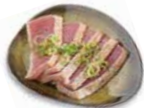
81. TUNA TATAKI € 5,50