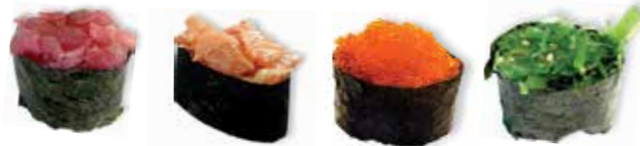
11. TONIJJN TARTAR Tonijn