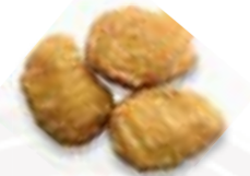
93. TORI NUGGETS Kip nuggets