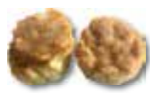
86. CHA SIU MAI Geb. garnalen en vleesmix