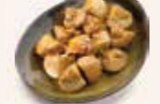
48. YAKI MUSHROOMS Champignons