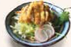
44. TORI SARADA Kip salade