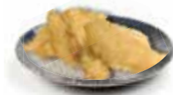
104. CITROEN VIS