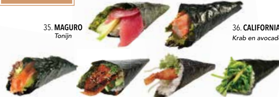
35. MAGURO Tonijn