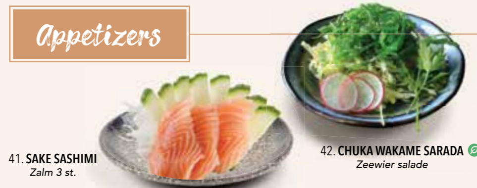
41. SAKE SASHIMI Zalm 3 st.