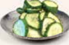
49. CUCUMBER TSUKEMONO Zoetzure komkommers