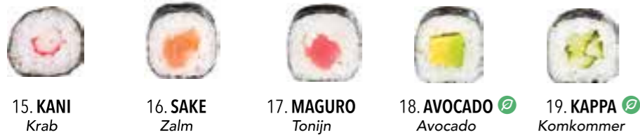
15. KANI Krab