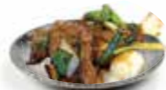
97. BIEF MET BOSUITJES EN GEMBER