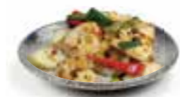
106. GARNALEN MET ZWARTE BONENSAUS