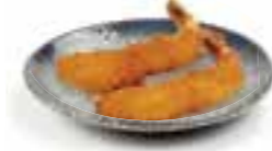
105. EBI FRY Krokante garnalen