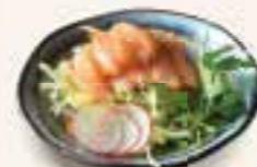
43. SAKE SARADA Zalm salade