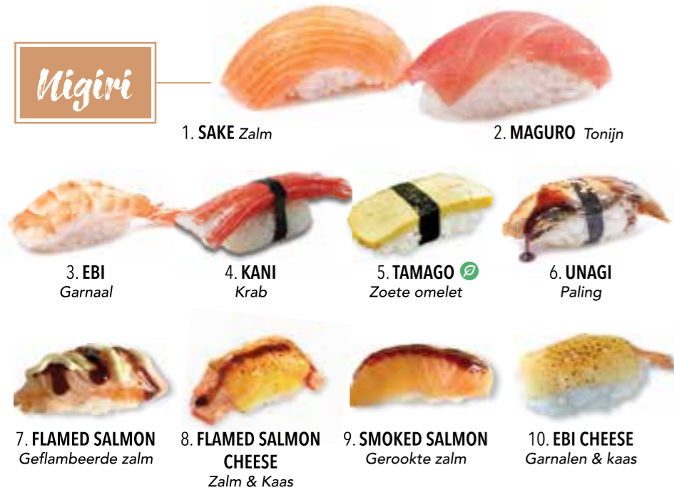
1. SAKE Zalm