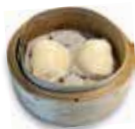
82. HA KAU Garnaal