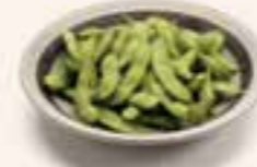
46. EDAMAME Sojabonen