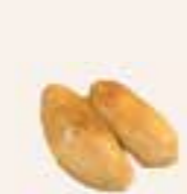
116. GEFRITUURDE BANAAN