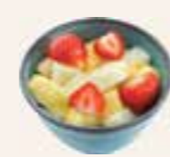
115. MIXED FRUIT