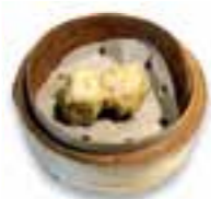
83. HA SIU MAI Garnaal & vlees mix