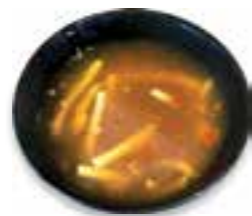
79. SUN LATONG Pikante soep