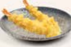
50. EBI TEMPURA Gamba's