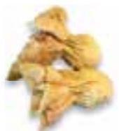
89. TORI CHIZU Kip en kaas