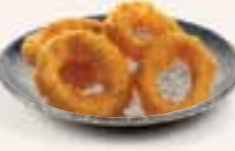
52. IKA FRY Inktvisringen