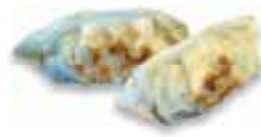
88. WO TIP KAU Gegrilde vleespastei