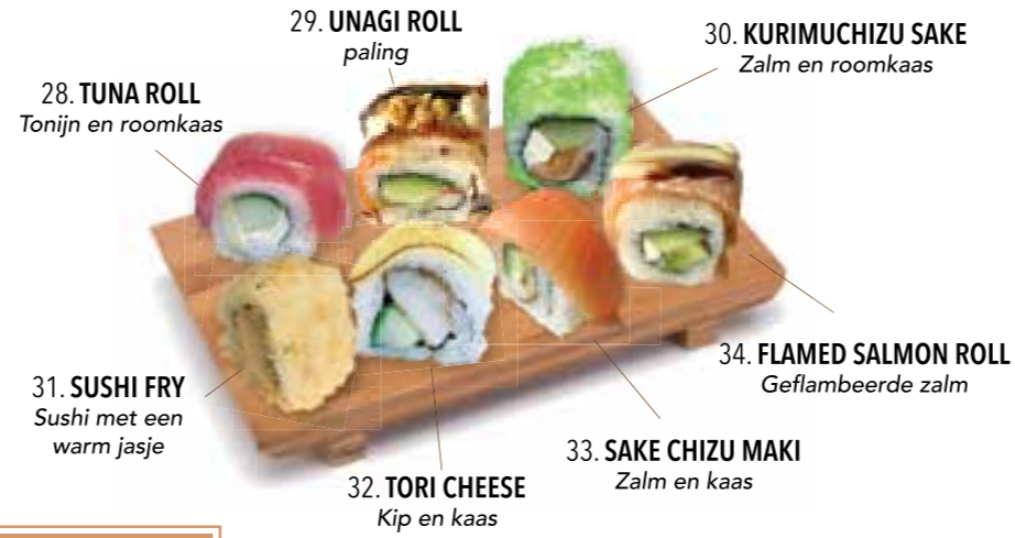
28. TUNA ROLL Tonijn en roomkaas