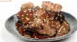
98. BLACK PEPPER & HONEY BEEF Rundvl. met zwarte peper & honing