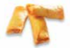
90. MINI LOEMPIA zonder vlees