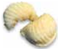
85. CHA HA KAU Geb. Dim Sum garnalen