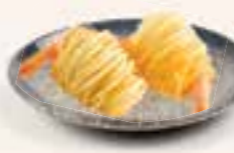
51. EBI KOROKKE Garnalen in aardappelbal