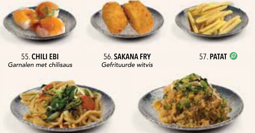
55. CHILI EBI Garnalen met chilisaus