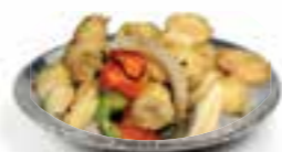
100. SPICY CHICKEN Gekr. kipblokjes