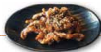
96. BEEF TERIYAKI Beef reepjes met teriyaki saus