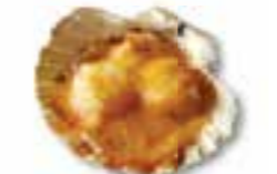
107. YAKI EBI CHIZU Garnalen in oven met kaas