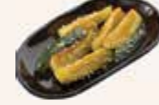
47. YAKI MORI Courgettes