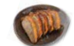
108. GEROOSTERDE EEND