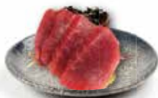
80. MAGURO SASHIMI € 4,50