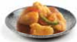
103. KOE LO YU Visfilet in zoetzure saus