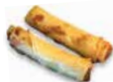
91. KAI SIE CHUN KUEN Kip loempia